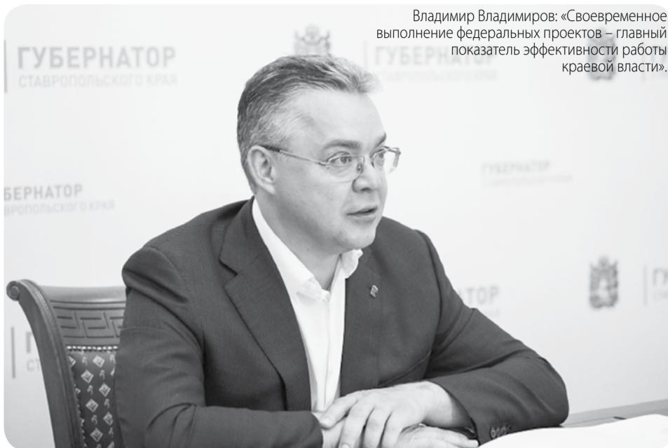
Владимир Владимиров: «Своевременное выполнение федеральных проектов – главный показатель эффективности работы краевой власти».

Произведён ремонт 29 участков региональных и местных автомобильных дорог протяжённостью более 78 километров. До конца года планируется отремонтировать ещё 32 участка длиной более 90 километров.