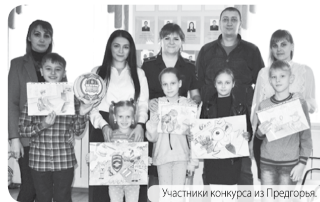
Участники конкурса из Предгорья.

В Предгорном муниципальном округе прошёл первый этап Всероссийский конкурс детского рисунка «Мои родители работают в полиции».