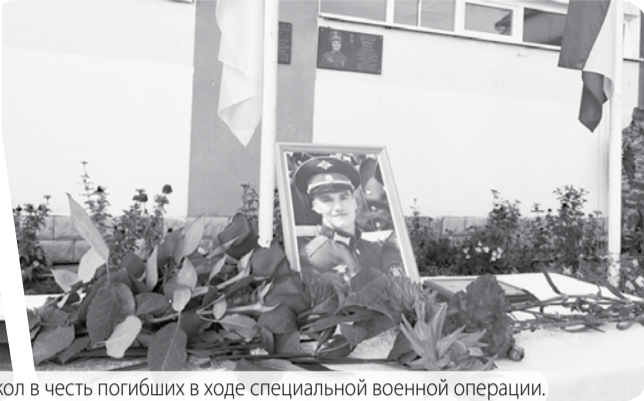
Мемориальные доски на фасадах школ в честь погибших в ходе специальной военной операции.